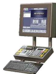
ETS 3000 (6 ejes)