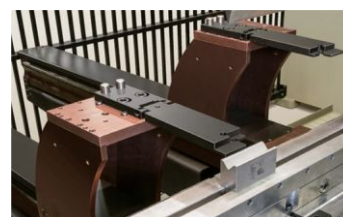
Tope Trasero Elite