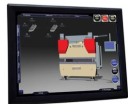
Control Vision (6 ejes)