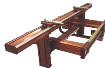
Tope Trasero Premium